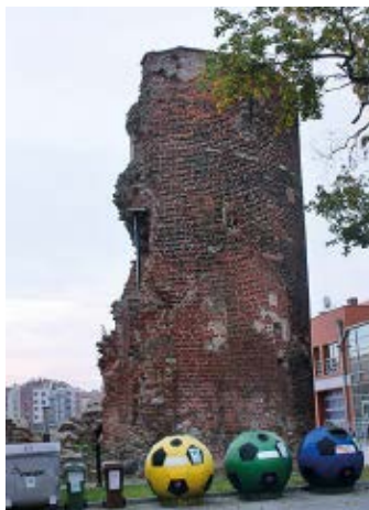
▲ Baszta Pod Zrębem

Do bastionu przylega Brama Nizinna , jedna z nowożytnych bram miejskich Gdańska. Została wzniesiona w 1626 r.