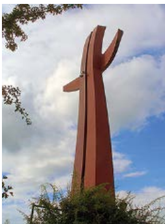
▲ Grodzisko, Krzyż Milenijny

Na terenie Fortu Góry Gradowej działa Centrum Hewelianum 📍 ul. Gradowa 6 ; www.hewelianum.pl , będące nowoczesnym centrum nauki. Jednostka łączy w sobie dbałość o dziedzictwo narodowe