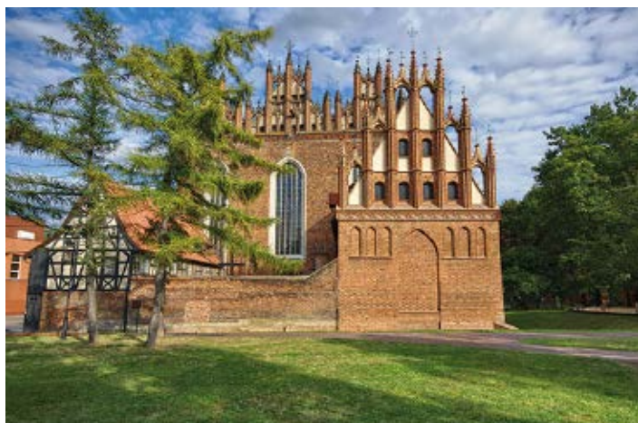
▲ Kościół św. Trójcy

Budynek wzniesiono pod koniec XIX w. w stylu neorenesansowym. Pierwotnie była to szkoła średnia dla dziewcząt, która swą nazwę zawdzięczała matce