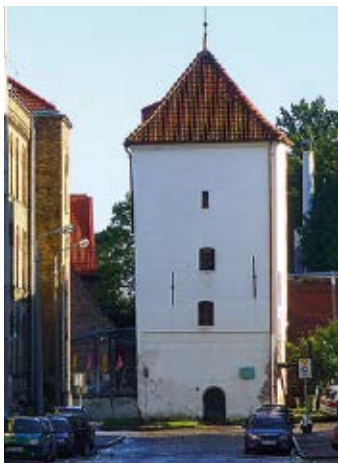
▲ Baszta Biała

wzniesiono Małą Zbrojownię projektu Jerzego Strakowskiego. Budynek miał służyć za magazyn ciężkich dział i moździerzy dla sąsiadujących umocnień. W przypominającym spichlerz obiekcie gromadzono żelazne i spiżowe działa (hala na parterze) oraz pistolety i strzelby (piętro). Na ścianie zewnętrznej zachował się piękny detal ozdobny przedstawiający herb Gdańska. Mała Zbrojownia jest dziś siedzibą Wydziału Rzeźby gdańskiej ASP.