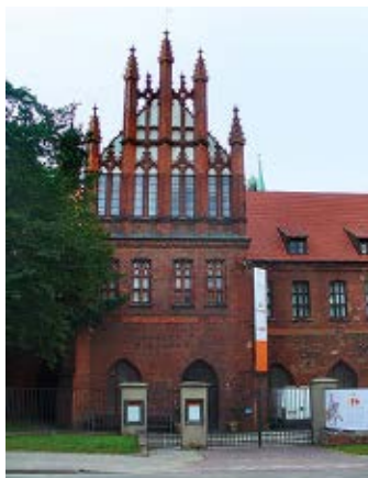
▲ Muzeum Narodowe

Tuż obok, w późnogotyckim klasztorze franciszkańskim zaaranżowanym na placówkę wystawienniczą, mieści się siedziba Muzeum Narodowego