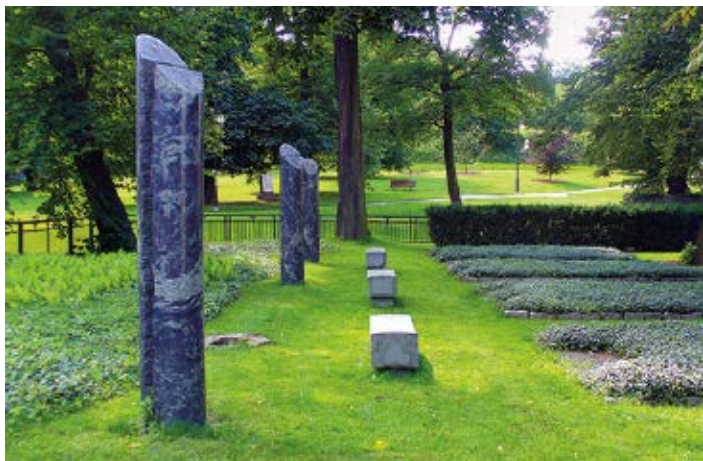
▲ Cmentarz Nieistniejących Cmentarzy