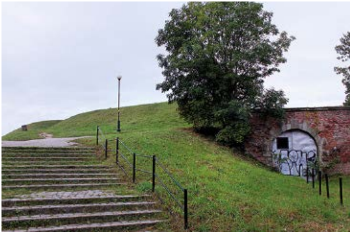
▲ Bastion św. Gertrudy