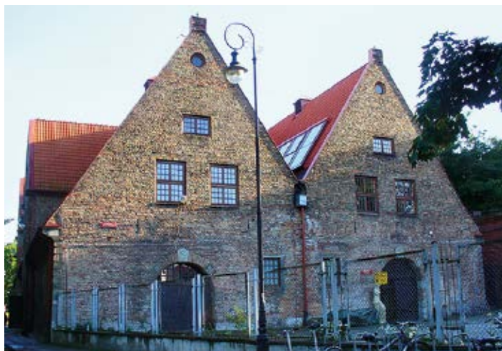
▲ Mała Zbrojownia

Przy placu Wałowym 15 mieści się Mała Zbrojownia . W trakcie rozbudowy gdańskich fortyfikacji w XVII w. okazało się, że arsenał już nie spełnia swojej funkcji (zwłaszcza ze względu na dużą odległość od najważniejszych obiektów wojskowych). Za najbardziej korzystną lokalizację uznano okolice dzisiejszego placu Wałowego, gdzie w latach 1643–45